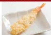
店内仕込の 海老天1尾 ¥300