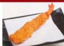
特製エビフライ 1尾 ¥300