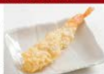
店内仕込の 海老天1尾 ¥300