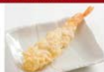
店内仕込の 海老天1尾 ¥300