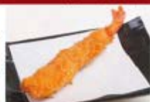
特製エビフライ 1尾 ¥300