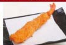
特製エビフライ 1尾 ¥300