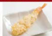
店内仕込の 海老天1尾 ¥300