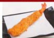
特製エビフライ 1尾 ¥300