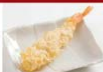
店内仕込の海老天1尾 ¥300