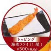
トッピング 海老フライ(1尾) ¥300(税込)

昔ながらの懐かしい味。 鉄板に卵液をまわしかけまろやかな風味の 名古屋風ナポリタンです。 店内仕込みの特製エビフライのトッピングがおすすめ!