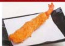
特製エビフライ1尾 ¥300