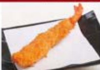
特製エビフライ1尾 ¥300