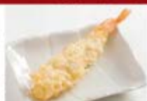
店内仕込の海老天1尾 ¥300