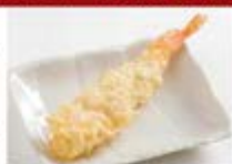
店内仕込の海老天1尾 ¥300