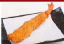
特製エビフライ1尾 ¥300