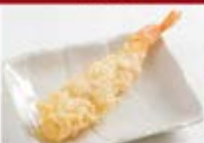
店内仕込の海老天1尾 ¥300