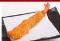
特製エビフライ1尾 ¥300